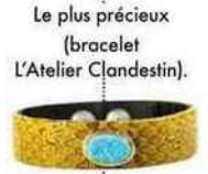
Le plus précieux (bracelet L'Atelier Clandestin).