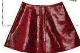
Le plus sexy (jupe Asos).