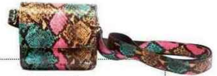
Le plus pratique (sac Inga).