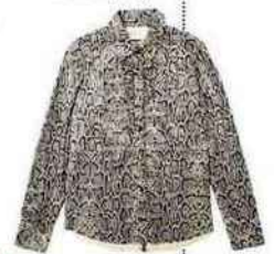
Le plus chic (blouse Leon & Harper).